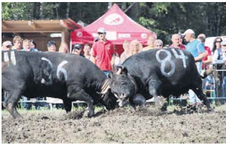
Spektakel. Den Zuschauern wurden tolle Kämpfe geboten.