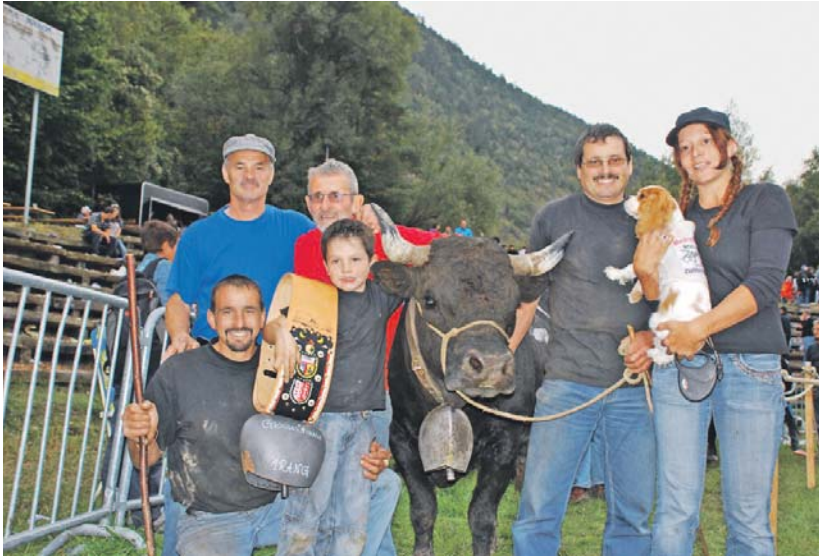
Tageskönigin. «Scharbo» heisst die erste «Reine de la Reine», die auf Oberwalliser Boden gekürt werden konnte.